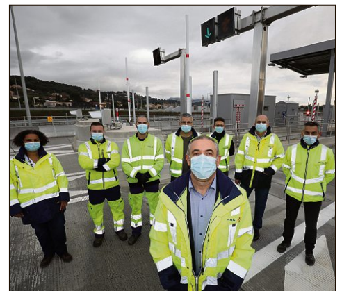
L'équipe d'exploitation de Vinci réunie quelques minutes avant la mise en service de l'échangeur.