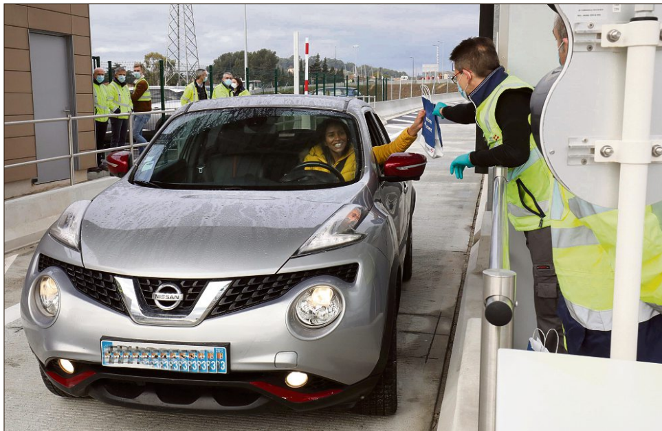
Les premiers utilisateurs du nouvel échangeur d'Ollioules-Sanary, hier matin, recevaient en cadeau de bienvenue un sac contenant un ballotin de chocolats et un petit livre sur Ollioules.